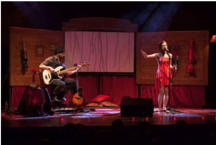
Live à la Halle aux blés (88)

Nous projetons entre les morceaux des scénettes sous forme de film d'animation, mettant en image le voyage de Ladislava. Offrez à votre public ce « petit plus » qui fait toute la différence.