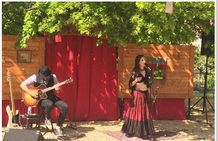
Live au Festival Jazzpote (57)