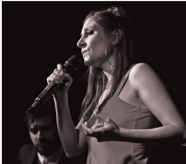
Live au Festival Bohème Rhapsodie (54)

Et plus de 300 représentations en France, Allemagne et République Tchèque.